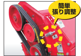
※撮影の為、カバーを外しています。